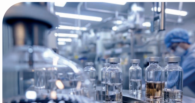
Industrie di processo (chimica, farmaceutica, cosmetica, ecc.)