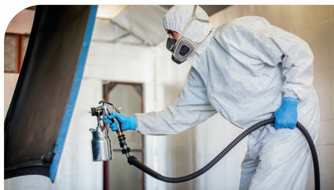
Stabilimenti di verniciatura industriale (automotive, ferroviario, ecc.)