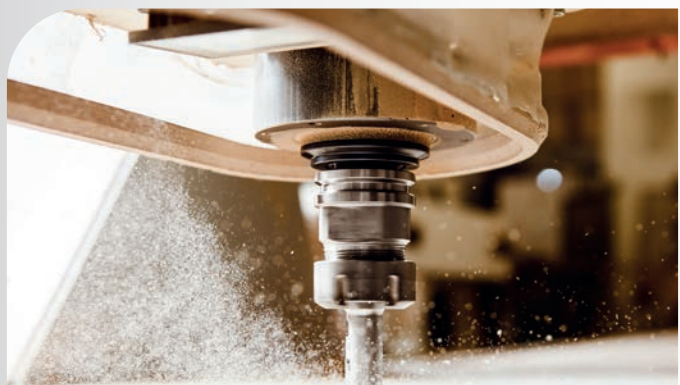
Industrie di trasformazione (legno, metalli, ecc.)