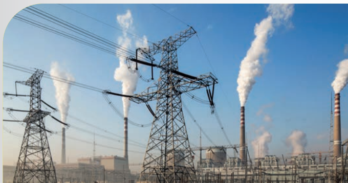
Produzione di energia elettrica (centrali a carbone, a gas, idroelettriche, ecc.)

Garantisce un'eccellente affidabilità delle misure, la sicurezza elettrica degli interventi e una maggiore produttività.