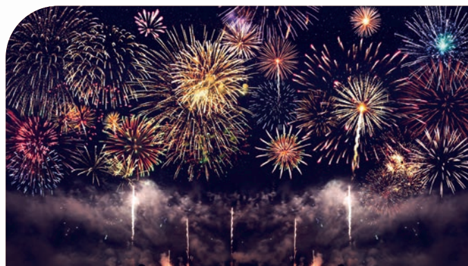
Industria bellica e pirotecnica (esplosivi, polveri, ecc.)