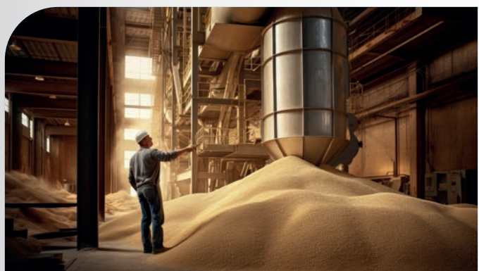
Industrie agroalimentari (farine, cereali, ecc.)