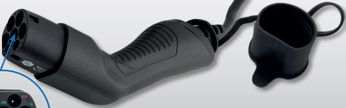
Prise IRVE de TYPE 2