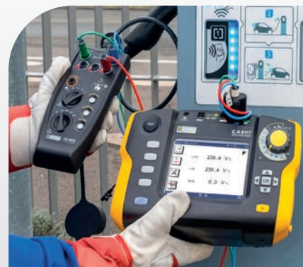
Contrôle des tensions délivrées par une borne avec DDR de type B/EV 6 mA, lors de la charge